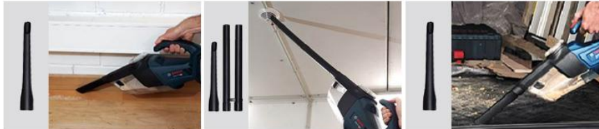
미세 먼지 청소