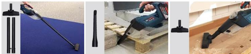
바닥 카펫, 나무 마루, 라미네이트, 타일 청소